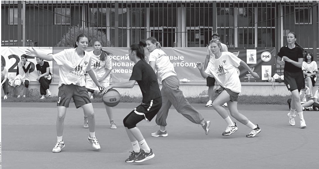
В этот день борьба за победу велась и на баскетбольной площадке

На спортивной площадке летнего лагеря дети вслед за сотрудниками оперативно-разыскной части собственной безопасности МВД по Карачаево-Черкесской Республике старательно выполняли комплекс упражнений. Полицейские продемонстрировали ребятам навыки владения рукопашным боем и приемами по обезвреживанию преступников. Несовершеннолетние попрактиковались в рамках мастер-класса.